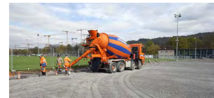
Einbringen Sickermaterial um Entwässerungsrohre