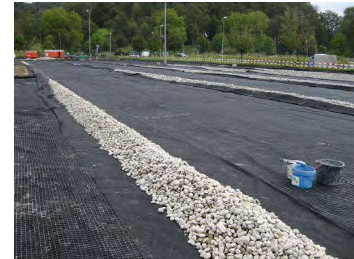
Umhüllung Drainageleitungen vor Einbau Fundationschicht