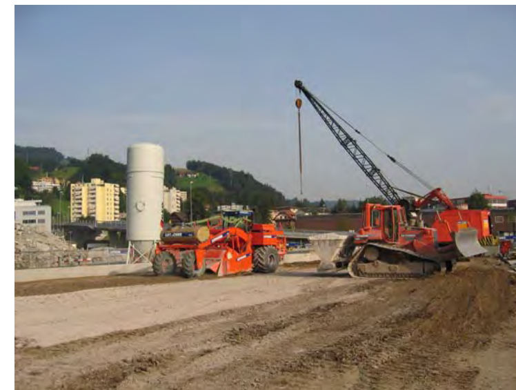
Untergrundstabilisation für Aufbau Sportanlagen