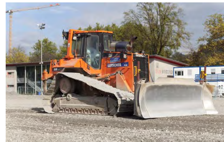
Einbringen Fundationschicht mit satellitengesteuerter Planieraupe