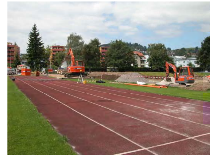
Grabarbeiten entlang Laufbahn