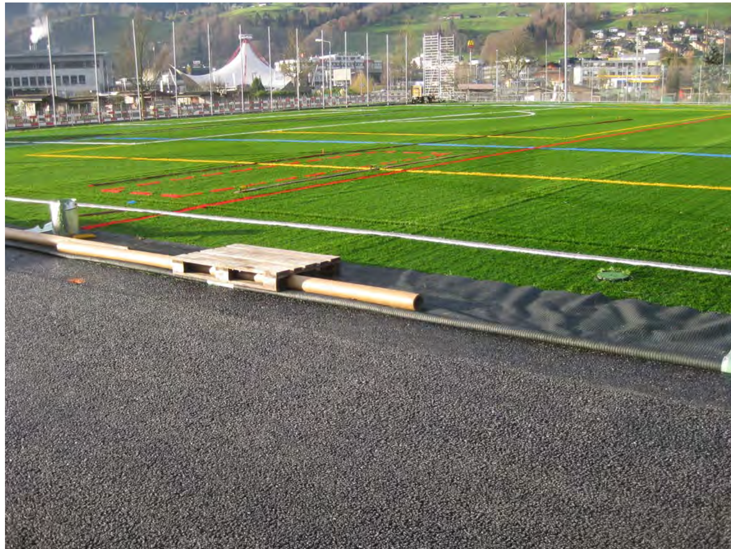
Kunstrasenspielfeld während Fertigstellungsarbeiten