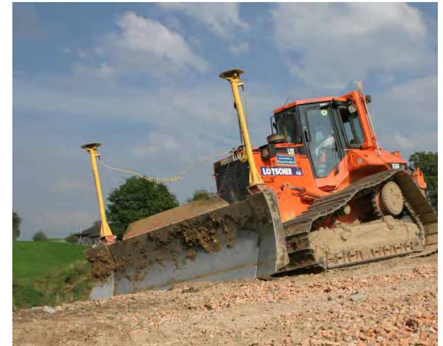
Planierarbeiten mit modernstem GPS-System