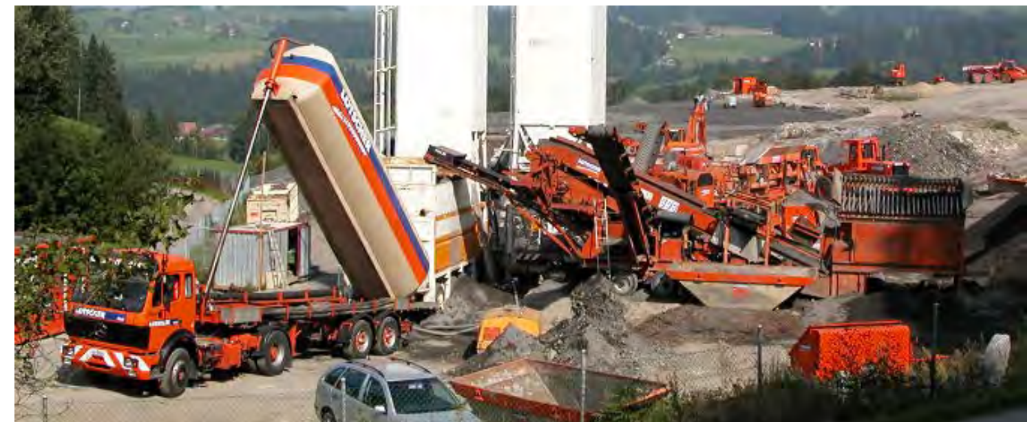
Aufbereiten, Sieben, Brechen und Zumischen von Bindemittel in einem Arbeitsgang