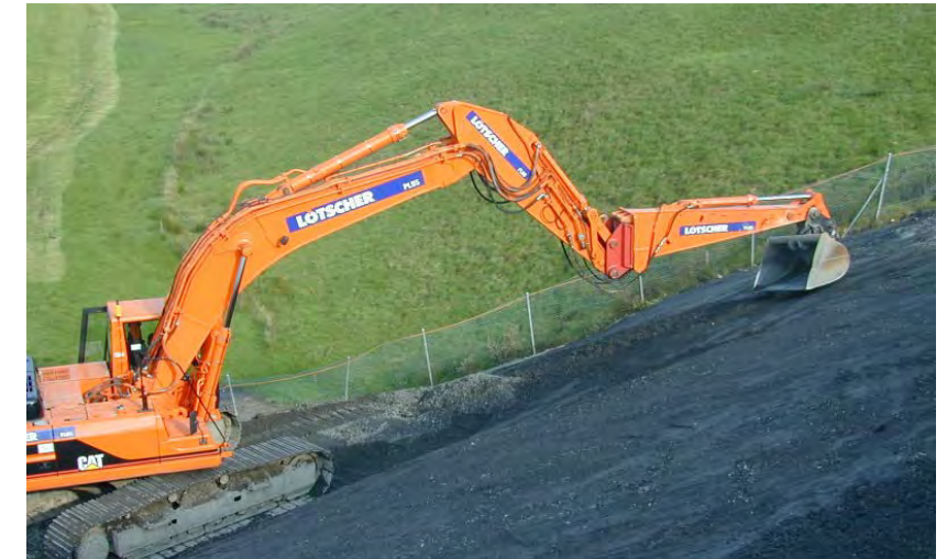
Erstellen von Planum und Böschungen mit satellitengesteuerten Baumaschinen