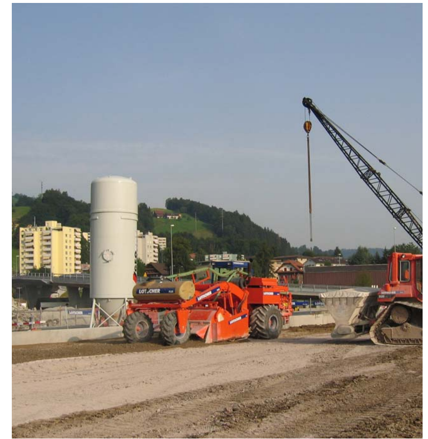
Bodenverbesserung vor Ort mit Beigabe von Bindemittel