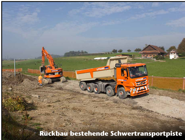
Rückbau bestehende Schwertransportpiste