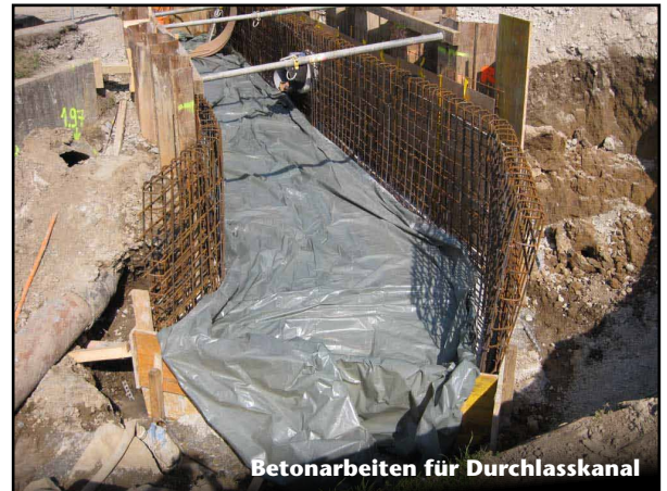
Betonarbeiten für Durchlasskanal