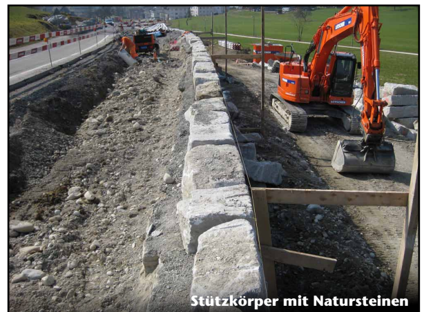
Stützkörper mit Natursteinen

loetscher-plus@ltp.ch www.tiefbau-plus.ch